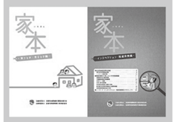
【本編、別冊の2冊セット 150円(税込・送料別)】

なお、同冊子の購入を希望される会員の方は、全宅連ホームページ会員専用サイトよりお申込みください。